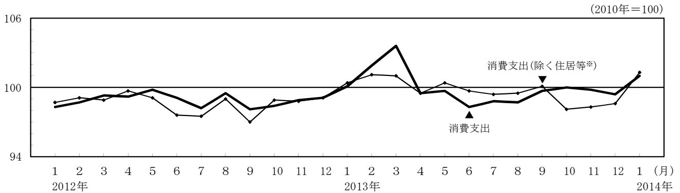
図3 消費支出（季節調整済実質指数）の推移（二人以上の世帯）